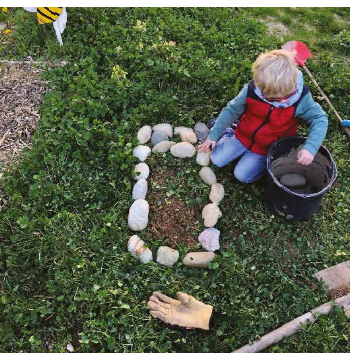
Marquez l'endroit pour retrouver votre slip.

Pour préserver ce précieux équilibre, bêcher la terre est vivement déconseillé, car cela met sens dessus dessous tout ce microcosme risquant de le mener droit à la mort.