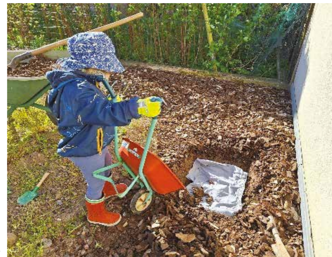
Ludique, le test peut se réaliser en famille.

Vous pouvez réitérer l'opération à différents endroits de votre jardin.