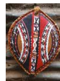
Tableau savane et grand jeu au programme des maternelles. Les plus grands réaliseront un masque africain/ Massaï ; l'après-midi des tournois de jeux africains seront mis en place.