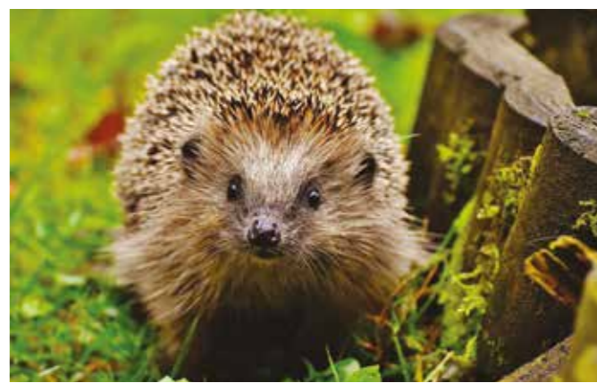
Les clôtures surélevées ou les haies laissent circuler les petits animaux.

Jardiniers chevronnés ou néophytes, adeptes du jardin au carré, déstructuré ou rustique, durant un an, la commission biodiversité du village vous propose quelques conseils et astuces pratiques pour faire rimer biodiversité et jardin de qualité.