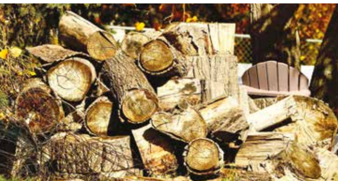
Les tas de bois sont des abris naturels pour les insectes.

Au-delà de l'aspect esthétique, un jardin plus «naturel» réduira la chaleur en été. Le jardin c'est aussi du sport: en cultivant votre extérieur, préparez votre summer body sans déboursier un centime! Et si vous êtes convaincu, mais que vraiment, vous n'avez pas le temps ou la condition physique, optez pour un paysagiste. Vous ferez en plus marcher le commerce local.