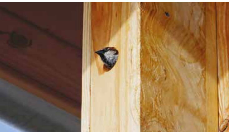
Moineau dans un nichoir.

avec une fauche au printemps et une en automne. Évitez novembre pour que le gazon reste haut en hiver et puisse ainsi protéger les insectes. Si vous n'êtes pas adeptes des herbes hautes, le bon compromis pour une cohabitation réussie serait de garder un petit endroit sans tonte. Cela donnera du relief à votre jardin qui n'en sera visuellement que plus beau! Pour le choisir, prenez le temps d'observer: où les enfants jouent-ils? Où avez-vous besoin de marcher régulièrement? ... Et optez ainsi pour un endroit où l'herbe haute ne gênera pas vos activités.