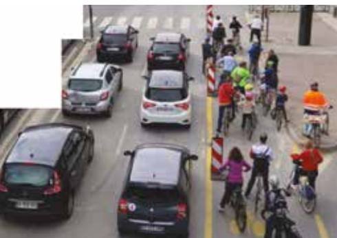
Pour le même espace : 6 voitures - 20 vélos

Les voitures occupent une place énorme! Il faut des routes, des parkings, des places de stationnement toujours plus grandes, larges pour les accueillir et toujours plus coûteux car l'espace urbain disponible se raréfie. En moyenne une voiture est occupée par 1,1 personne pour aller au travail. Et même dans les familles, ce nombre n'est pas beaucoup plus important (1,6).