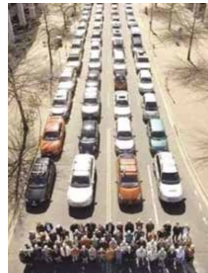
Espace pour le même nombre de personnes en voiture ou à pied

Les voitures occupent une place énorme! Il faut des routes, des parkings, des places de stationnement toujours plus grandes, larges pour les accueillir et toujours plus coûteux car l'espace urbain disponible se raréfie. En moyenne une voiture est occupée par 1,1 personne pour aller au travail. Et même dans les familles, ce nombre n'est pas beaucoup plus important (1,6).