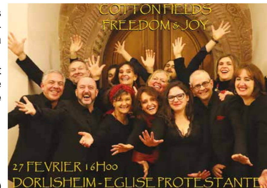
27 FÉVRIER 16h00 DORLISHEIM - EGLISE PROTESTANTE