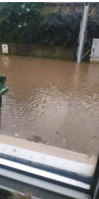
Inondation rue de l’Altenberg juillet 2021

Une des ressources à préserver au cours de notre siècle est... l’eau.