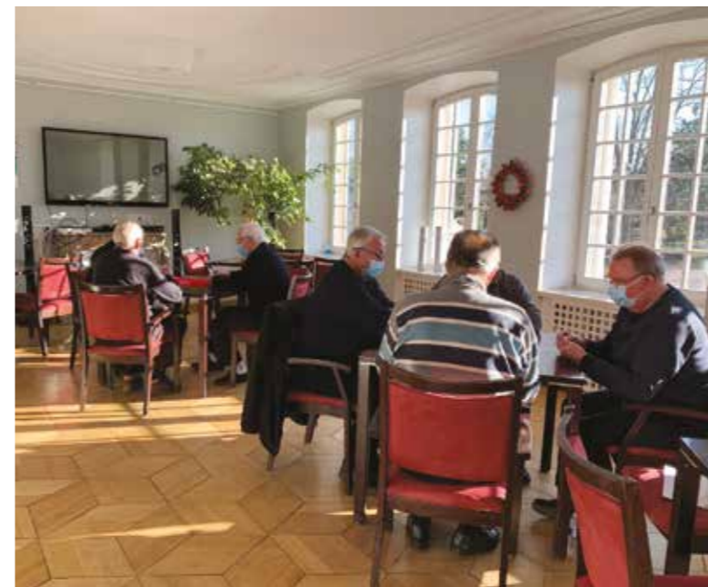
Les mercredis après-midi, des joueurs invétérés de rami et belote

Et bien sûr, les soirées ateliers cuisine, conférences, musique et divertissement!