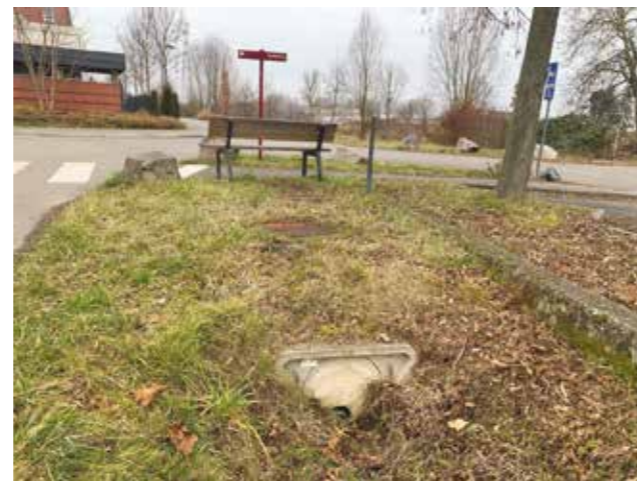
La noue rue Ziegelmeyer