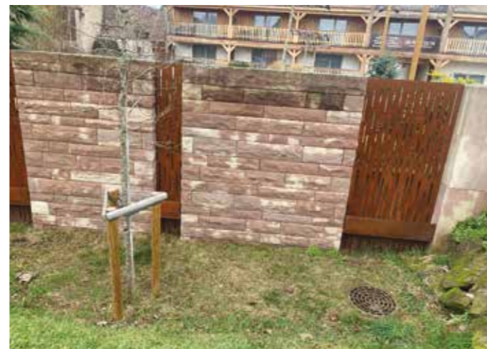
Le fossé à l’arrière du parking de l’hôtel Le Dormeur (rue des Remparts)

Sur ce dernier exemple, nous pouvons toutes et tous être acteurs à notre niveau.