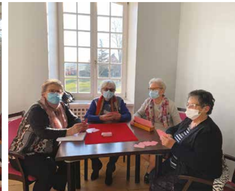
Les mercredis après-midi, des joueuses invétérées de rami et belote

En parallèle, le Château accueille d'autres activités comme le « Vivement dimanche », le « café Kueche » initiées par le CCAS ou celles proposées par l'Université populaire (activités payantes)... Les associations sont également les bienvenues; les Passionnés du bois occupent le caveau du Château à certains créneaux. Il existe bien d'autres événements comme les conférences organisées par les caisses de retraite complémentaire (sur la prévention du diabète...) ou par des passionnés jeunes et moins jeunes qui souhaitent transmettre leur savoir. Les expositions d'artistes sont également les bienvenues lors de journées du patrimoine ou autres.