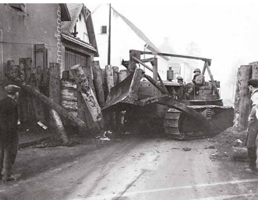
Le barrage Faubourg des Vosges balayé par un bulldozer américain (crédit photo Sissi Jost).

Roland, qui a remplacé Guy pour aujourd'hui, comme radio, m'engueule: "Pourquoi tires-tu sur des gars qui se rendent?" C'est peut-être vrai, mais il oublie que ces gars se rendaient, munis de leur Panzerfaust et qu'ils étaient capables de nous descendre. "Ils se sont rendus, parce qu'ils nous avaient ratés!"