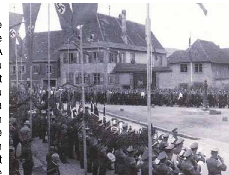
La place du village en juillet 1942 lors du passage du Gauleiter