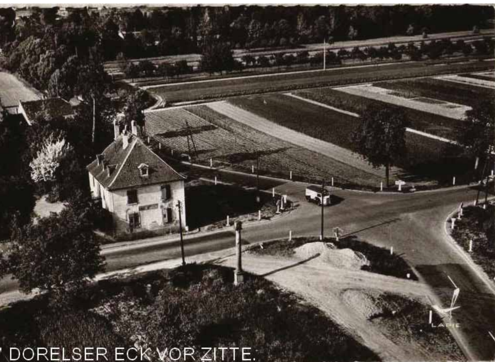
DORELSEK ECK VOR ZITTE.

L'aménagement du carrefour de la mort (transformé en rond-point). L'actuel rond-point de la colonne (entrée Est du village) est l'aboutissement de plusieurs transformations successives à partir des années 1960. Une grande bâtisse trônait à l'intersection de ce qui était alors le croisement entre la nationale 392 (l'axe Strasbourg-Schirmeck) et la nationale 422 de Saverne à Sélestat). Elle était au bout d'un grand parc qui a été morcelé au fil du temps. En 1962, après les accords d'Évian, deux familles de rapatriés d'Algérie y ont logé au rez-de-chaussée, une partie de la maison avait été réquisitionnée par l'État avant l'expropriation de la famille propriétaire. Cette bâtisse avait été un débit de boissons pendant un temps (on voit encore l'empreinte de l'enseigne sur la carte postale). La colonne napoléonienne qui se dresse sur le promontoire du rond-point rappelle que le préfet Lezay-Marnésia avait entrepris de créer un système de signalisation des grands axes routiers. Certaines colonnes (il n'en reste que quelques-unes) ont des indications gravées dans le grès, d'autres étaient garnies de plaques en fonte avec la direction des villes importantes (les plaques ont été pillées). La colonne de Dorlisheim ne porte aucune signalisation, elle a été gravement endommagée en 1960 par une voiture « 4 CV ». Ce qui