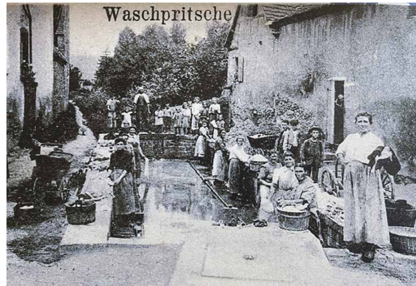
Intersection Rue du Lavoir/Grand Rue

La Blieth a été comblée au début des années 1970 : aménagement de la Rue du Lavoir, de la Rue des Prés, du Gaentzig. Les lavoirs ont été démantelés les uns après les autres, battre le linge à genoux sur un socle de grès n'était plus la vie rêvée des femmes. Le dernier en date était celui qui se trouvait au bord du ruisseau, le « Schiffbach », juste derrière le stade de football. À force d'être vandalisé, il a aussi été démantelé.