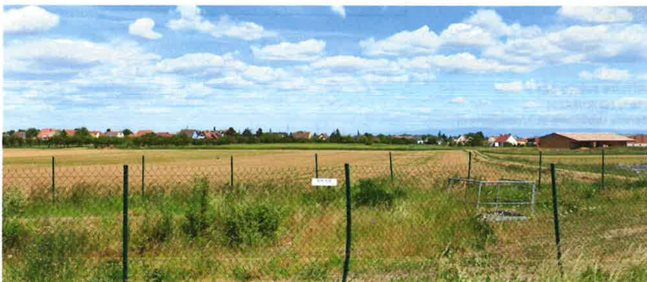
Figure 1: Vue de la zone IAud depuis la D1420.

l'augmentation de hauteur en zone IAud ne devrait pas avoir un impact négatif significatif sur la silhouette urbaine visible depuis la D1420 (en particulier, les crêtes de la Forêt-Noire devraient rester visibles).